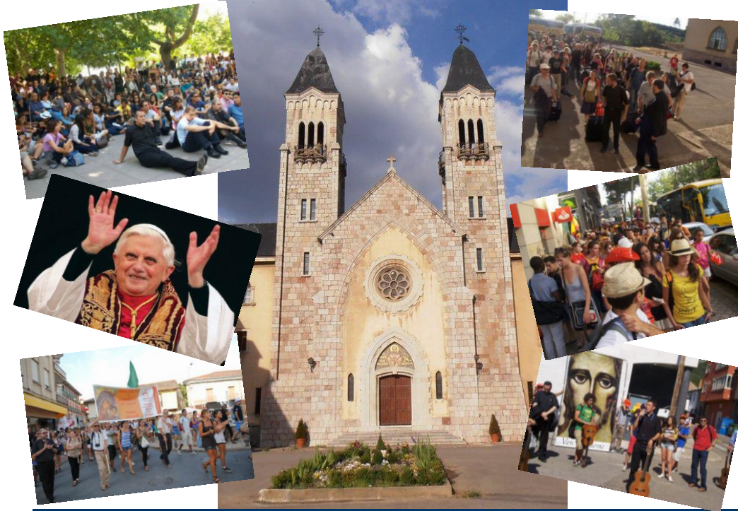
Jóvenes en la JMJ