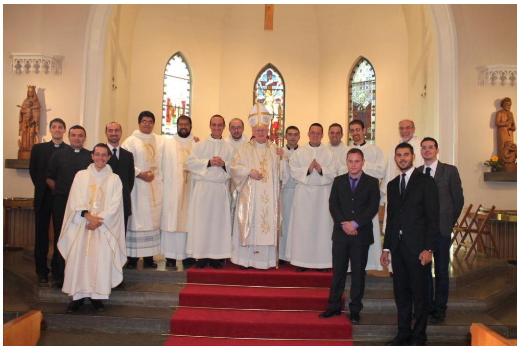
Los formadores del Seminario

La paz del Verbo, che de rico y potente que era se ha hecho pequeño y pobre para venir a vivir en medio de nosotros, este con todos vosotros!